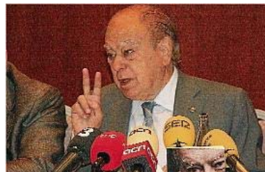
L'expresident Jordi Pujol en la presentació d'ahir.

L'expresident de la Generalitat Jordi Pujol va dir ahir que "té tota la lògica del món" que antics alts càrrecs dels seus governs es proclamin independentistes ara, en resposta al "maltractament" que ha patit Catalunya els últims anys.