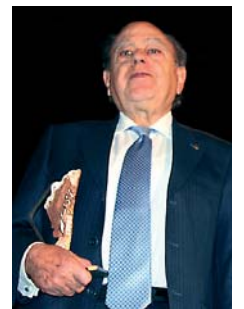
Jordi Pujol, EFE

lo empresarial en España, hasta la fecha basado en la cultura del apalancamiento. "Estamos entrando en un nuevo paradigma. Es imprescindible recapitalizar las empresas y los líderes de opinión han de hacer pedagogía en este sentido" afirmó. "No son viables ya modelos de gestión basados en apalancamientos del 80 y 90%. Las empresas que sigan ese modelo están muertas". ❖ J. MARQUES